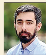
مهدی روشانی دبیرکل نهاد کتابخانه‌های عمومی

بر این اساس نهاد، به‌عنوان متولی مدیریت کتابخانه‌های عمومی در ایران، در کنار توسعه کتابخانه‌های عمومی (از روستایی و سیار تا شهری و مرکز استانی) و مدیریت بیش از ۲۶۰۰ کتابخانه در سراسر کشور از توجه به حوزه کودک غافل نشده