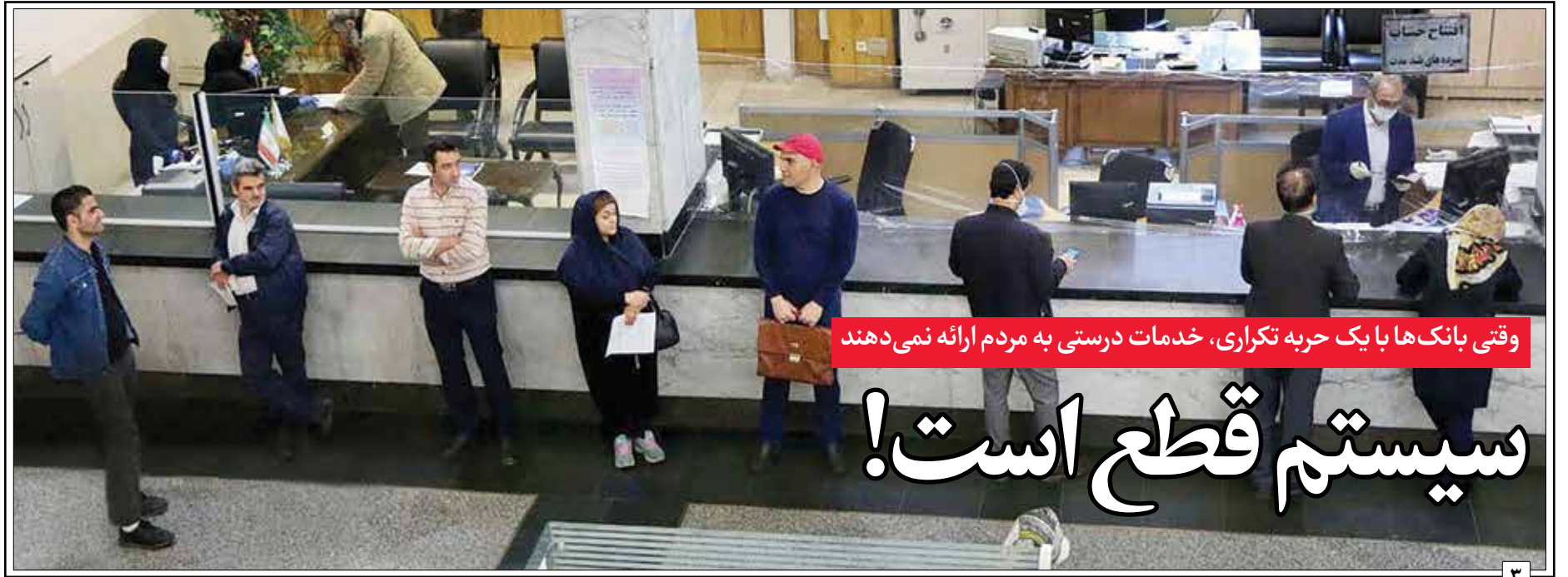
وقتی بانک‌ها با یک حربه تکراری، خدمات درستی به مردم ارائه نمی‌دهند