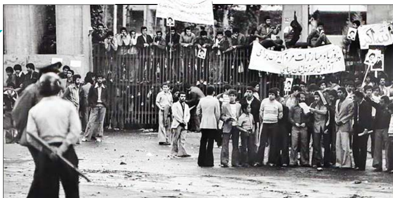
انقلاب اسلامی مقدمه انقلاب بزرگ مهدوی است

در بخش نخست این مطلب درباره تغییر، ویژگی‌ها و انواع آن گفتیم؛ این که انقلاب اسلامی، از اساس حرکتی برای تغییر به سمت جلو و در راستای ایجاد مقدماتی برای آن تغییر بزرگ و موعود است که به واسطه ظهور حضرت صاحب‌العصر الزمان (عج) در جهان روی خواهد داد و گفتیم درس بزرگ امام در کلمه به کلمه صحیفه نور، ایستادگی بر پیمان عبودیت و ادامه مقاومت علیه طاغوت و تغییر مدام خود و جهان است، این در دنباله آن بحث فطرت طلب جمال و کمال الهی و تغییر از موجود پای در بند خاک به موجودی پران در افلاک، در انسان گمگشته در غبار و تاریکی یکسر محو نمی‌شود بلکه کرمز و منحرر می‌شود. در راه مفشوش و پیچ در پیچ و هیچ می‌افتد. پس در اوج کفرورزی هم آدمی در پی تغییر است و با تفکر نابینا و بی‌راه بلد و با عقل ضایع و خود را، او همام تفکر برای تغییر می‌یابد که اسیر نفس سرکش و شیطان اوست. پس ما در زمین یک تغییر خواهی وضع موجود به سوی وضع مطلوب الهی در مقام عبد خالص را مشاهده می‌کنیم برای پرواز روح الهی به سوی محبوب که آیت کامل آن حبیب خدا محمد رسول... است. این کمال در مراتب مختلف شامل بندگان خالص و مخلص رب العالمین و پیروان دلباخته حبیب... (ص) و امیرالمؤمنین، نفس نفیس محبوب خدا، ولی... الاعظم، مولا علی (ع) و همه شیعیان صادق اهل‌البیت هم می‌شود.