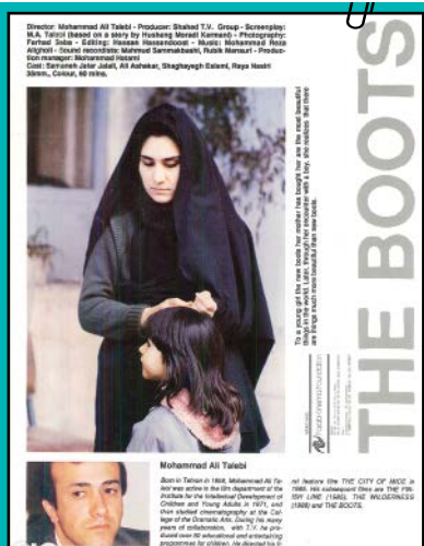
پوستر «چکمه» که در کاتالوگ یکی از جشنواره‌های خارجی