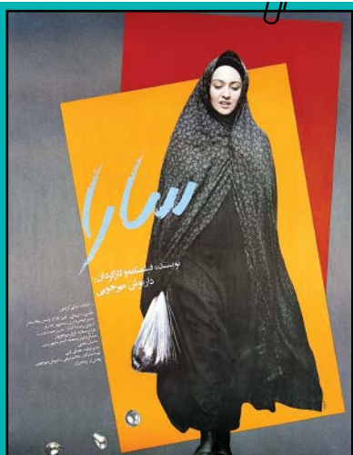
تصویر از نیکو کریمی در پوستر «سارا»