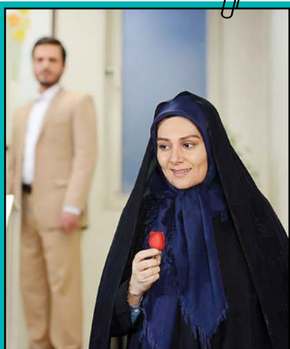
هنگامه قاضیانی در فیلم «دلبری»