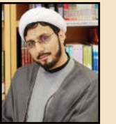
دکتر رجایی پژوهشگر سیره‌پژوهی مدرس حوزه و دانشگاه

یکی از ویژگی‌های منحصر به فرد در روش تبلیغی حضرت ابراهیم(ع) این است که وقتی می‌خواست با مردم جامعه صحبت کند مانند آنها می‌شد، درد جامعه را می‌چشید و از درون جامعه به نقد گفت‌وگو آنها می‌پرداخت و با زبان نرم به هدایت آنها می‌پرداخت. مانند نفی ستاره پرستی و خورشید پرستی که در تاریخ زندگی حضرت ابراهیم(ع) و آیات قرآن به آن اشاره شده است. این راز موفقیت حضرت در مبارزه با انحرافات فرهنگی مانند بت پرستی است.