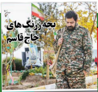
بچه زرنگ‌های حاج قاسم