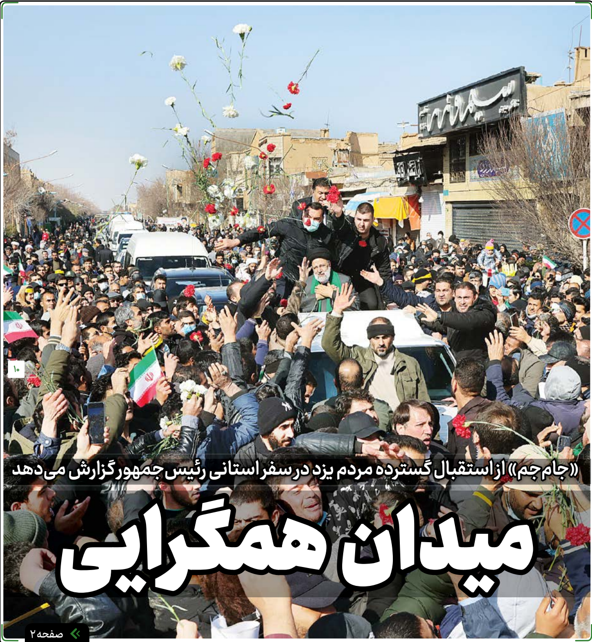
«جام جم» از استقبال گسترده مردم یزد در سفر استانی رئیس جمهور گزارش می دهد