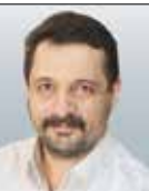
ارش شفاهی آرگوه فرهنگ و هنر

وی با اشاره به این‌که تأمین منابع برای رسیدن به مصوبه یاد شده نیازمند همکاری مجلس و توجه بیشتر به حوزه فرهنگ است، گفت: در هفته‌های اخیر در راهروهای مجلس دستگاه‌های مختلف نمایشگاه دستاوردهای خود را برگزار کردند و خانه کتاب و ادبیات ایران نیز نمایشگاه ظرفیت‌ها و دستاوردهای حوزه ادبیات و نشر کشور را در مجلس شورای اسلامی برگزار کرد و سعی کردیم این موضوع و دیگر موضوعات حوزه نشر و ادبیات را به نمایندگان مجلس منتقل کنیم. به هر حال اگر در حوزه‌های دیگر پول هست و خوب خرج می‌شود، آنچه به دست ما می‌رسد، این مقدار است. البته ما سعی کردیم در همین شرایط هم مبلغ جایزه جلال را با فاصله بالاتر از مبلغ جایزه کتاب سال جمهوری اسلامی قرار دهیم.