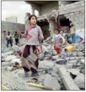
یک کودک در حال گریه در میان آوارهای کربلا

در حالی که جهان در وضعیت اضطراری ناشی از شیوع ویروس کرونا قرار دارد عربستان سعودی همچنان به جنایات گسترده خود در یمن ادامه می‌دهد. متجاوزان سعودی طی یک هفته اخیر در حالی حملات هوایی خود علیه یمن را شدت بخشیده اند که دبیر کل سازمان ملل احواس‌تار توقف حملات و