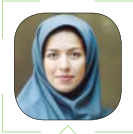
عسل اخویان طهرانی دانش

با ادامه شیوع ویروس کووید-۱۹ و گذشتن از مرز یک میلیون مبتلا در جهان، سال ۹۹ با تلاش شبانه‌روزی پژوهشگران ایرانی آغاز شد. چنان که در روزهای پایانی سال ۹۸ و همچنین در روزهای تعطیلات نوروز، شاهد انتشار خبرهای امیدبخشی از پژوهشگران خستگی‌ناپذیر حوزه تحقیقات پزشکی بوده‌ایم. از پژوهشگران جهاد دانشگاهی گرفته تا دانش‌بنیان‌ها و سازمان صنایع دفاع همه پایه کار آمده‌اند.