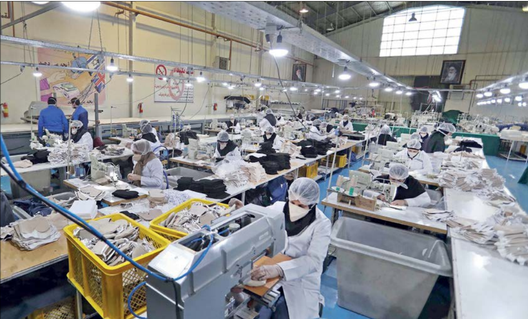
برخی کارخانجات با تغییر خط تولید، به محصولات بهداشتی رونق یافته‌اند.

عضو کمیسیون صنایع و معادن مجلس شورای اسلا می‌با تاکید بر این‌که کمک