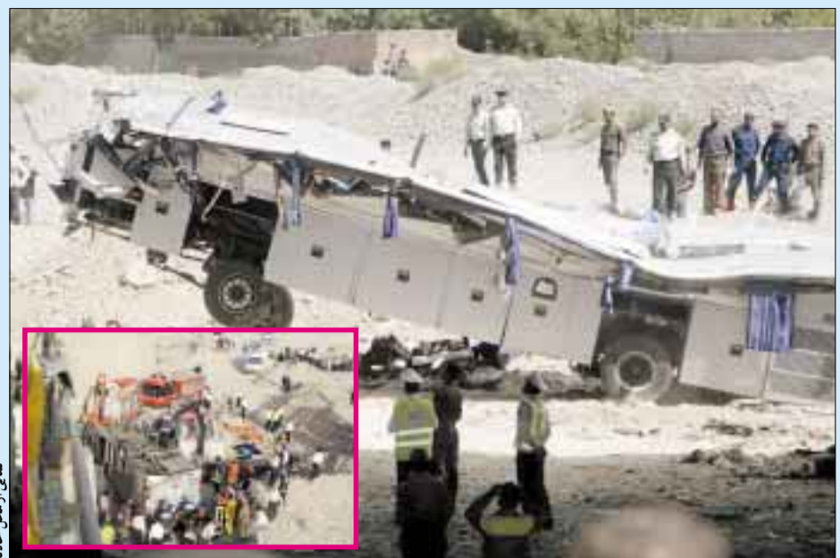
سقوط اتوبوس مسافربری با ۱۳ کشته و ۱۴ مجروح